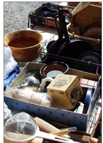
Kom och sälj eller köp!

En bakluckeloppis kan ju inte fungera utan köpare! Så se till att du bokar dagen och kommer och gör fynd bland bakluckorna.