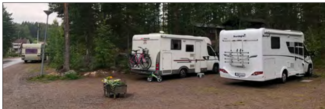
Gullnäsgråden har fyra ställplatser med el.