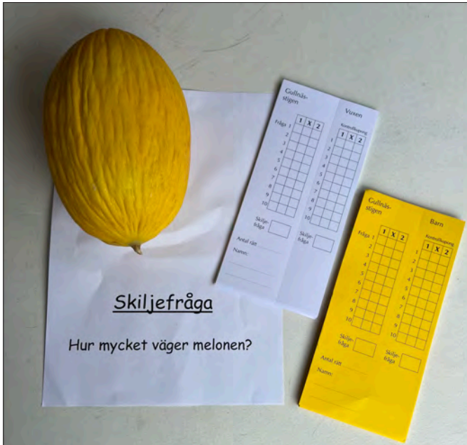
Hur mycket väger en melon?

Han släppte sin första lovsångsskiva 1989, Vind Över Vatten . Han har sedan dess släppt många skivor, de flesta med en lovsångsprofil.