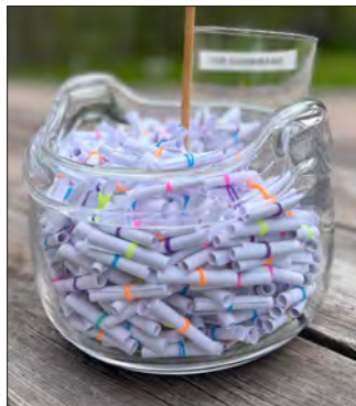
Mannakort – en liten andakt.

Som en övning i att lita på Guds försörjning åt israeliterna detta himmelska bröd under sin flera decennier långa vistelse i öknen. Enligt Psalm 78:24 smakade manna som honung.