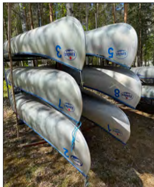
Gullnäsgården har nio kanoter.

Om du hellre vill hyra vår roddbåt går det naturligtvis också bra. Inte minst om du vill fiska i Varpan. Se artikeln på sidan 5.