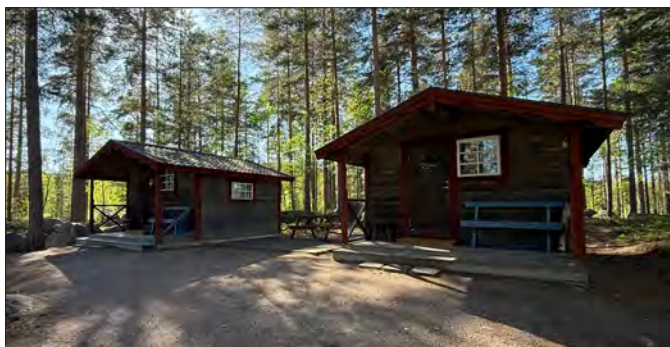
Stugorna heter Ingvarsbo och Gunnarstorp.

Via hemsidan går det också att boka logi och ställplats.