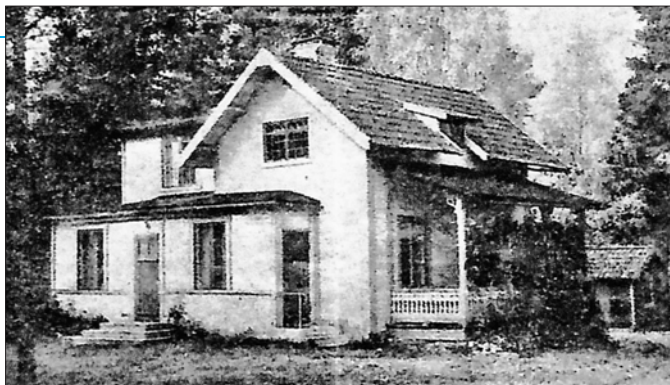
Gullnäsgården år 1947.