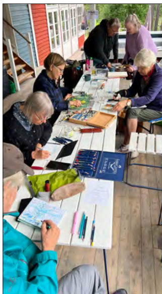
Lördagsmålning kl. 10.00.