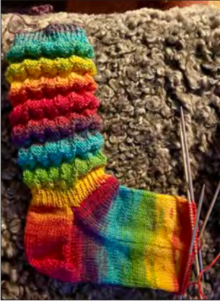
Sticka eller virka, fika och samtala. Välkommen på torsdagar!

Tycker du om att sticka och virka och vill ha lite sällskap? Då är du välkommen till Gullnäsgränden på torsdagar klockan 13.00.