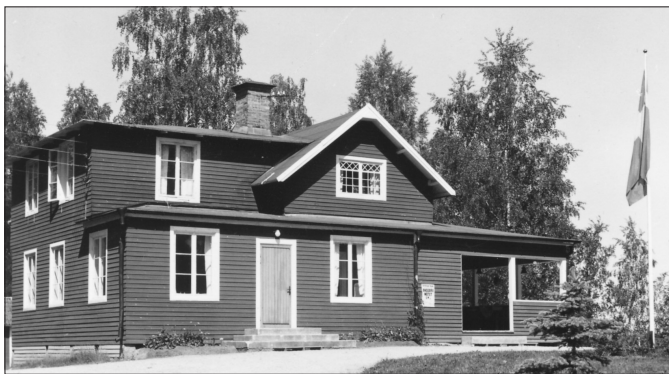
Gullnäsgårdens entrésida har byggts ut och om flera gånger under årens lopp. Vykort med okänt årtal.

Har du minnen? Har du bilder? Har du gått i söndagsskola här? Kanske dina föräldrar besökte Gullnäsgården i sin