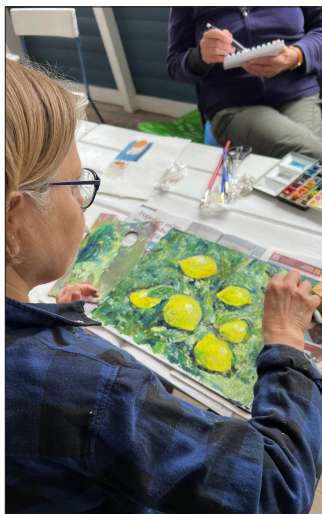
Lördagsmålning klockan 10.00.

Och du: du behöver inte vara konstnär för att komma. Ett intresse för färger och gemenskap räcker långt!