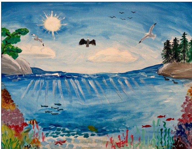
Dag fem – "Vattnet skall vimla av levande varelser, och fåglar skall flyga över jorden, under himlavalvet." Bilden är något beskuren.