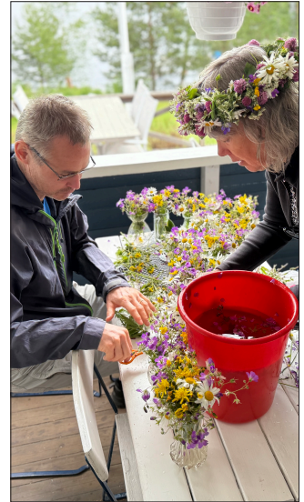
Hjälp önskas med majstången.